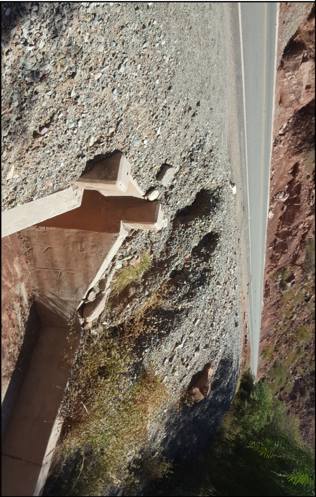
VISTA SUPERIOR - CRUCE DE ALCANTARILLA CON FUNDA METÁLICA Y DADOS DE HORMIGÓN